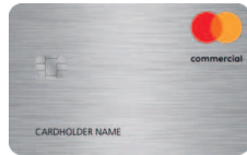
Mastercard® Commercial Silber