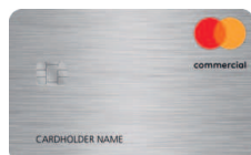
Mastercard® Commercial Silber