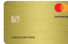
Mastercard® Commercial Gold