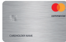
Mastercard® Commercial Silber