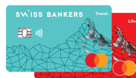
Swiss Bankers Travel/Life