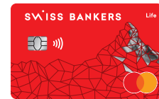
Swiss Bankers Life Prepaidkarte