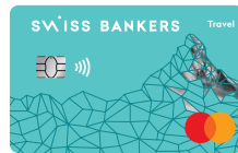
Swiss Bankers Travel Prepaidkarte

Noch nie war das Bezahlen im Geschäft so einfach und unkompliziert wie mit Mobile Payment – ganz einfach über das Handy oder die Smartwatch. Aktivieren Sie in der Swiss Bankers App das Bezahlen mit Apple Pay, Samsung Pay oder einer Zahlungsmethode eines anderen Anbieters. Und schon ist die Karte für das mobile Bezahlen freigeschaltet.