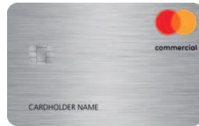
Mastercard® Commercial Silber